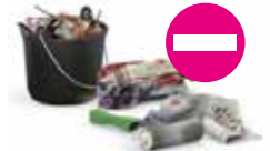
Les matériaux souillés...