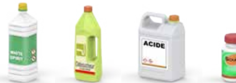
Produits spécifiques de la maison