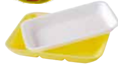
Barquettes en polystyrène