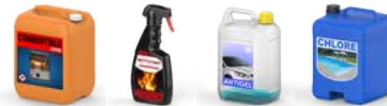
Cheminée et Barbecue, Entretien du véhicule, Entretien de la piscine...