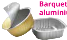
Barquettes en aluminium