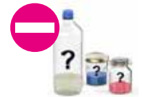
Les produits non identifiés