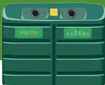
Pots et bocaux