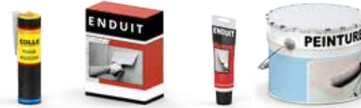
Bricolage et Décoration

Les déchets issus des produits d'entretien, de bricolage et de jardinage sont à apporter en déchèterie.