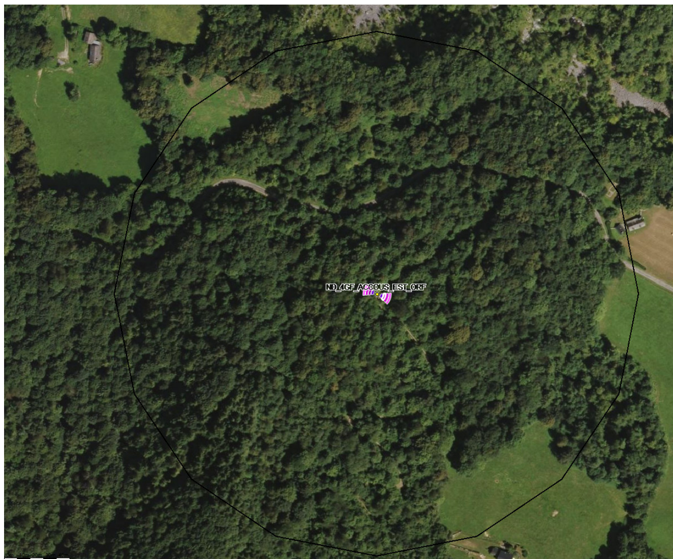
Fond de carte (photo aérienne).